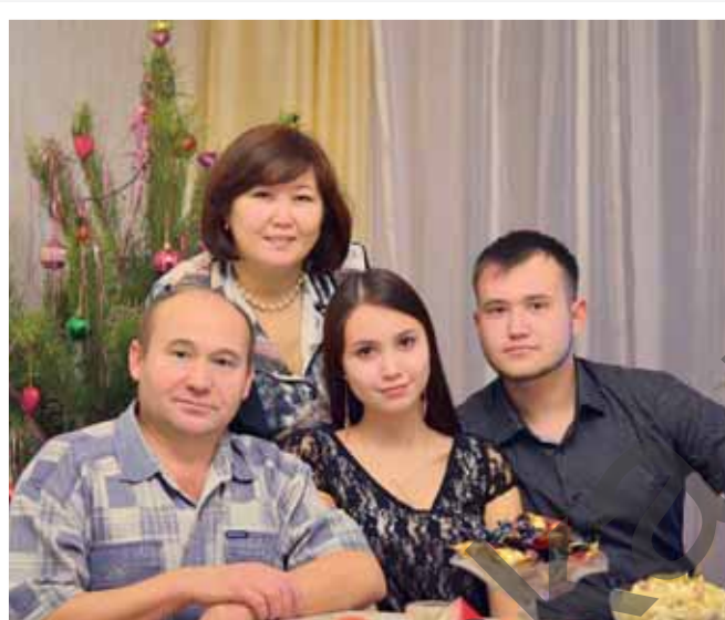
«Ғаиләм — кәлғәм»

көнсығыш башкорттарының социаль-иқтисади һәм сәйәси тарихы» тип аталды.